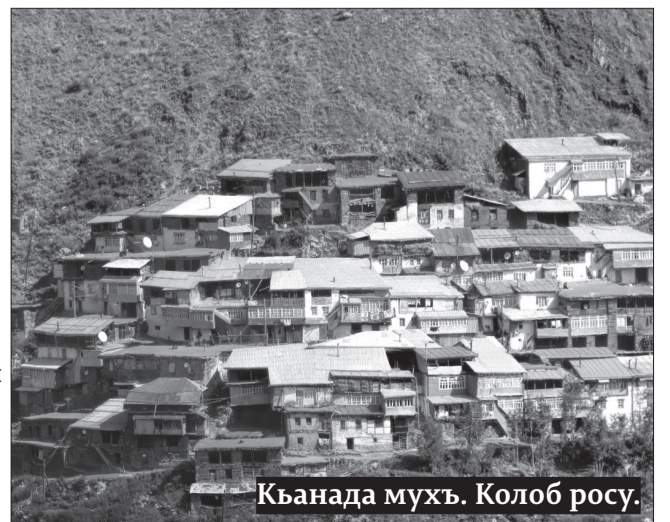
Къанада мухъ. Колоб росу.

ЛъаратІа районалъул нек'сиял росабазде гъорлъе унел Колоб, Къанада, Гъагъар, Цимгъуда, Огъохъ (ахирисеб лъабго росо г'одоблиялде гочана) росабалъ г'умро-яшав гъабун ругел г'адамазда, къаналалин абунла. Гъел росаби руго Богоссалъул муг'рузул т'елалъул гъулдузда, Авар г'урулъе чвахулеб Жумрут г'урул раг'аллъабазда.