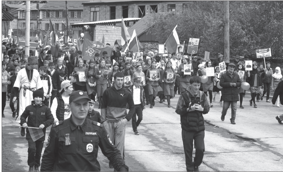
Начало на 3 стр.

Ватаналгье гьоло рухI кьурал бахарзал кюдо гьарулел руклана 9 ма-ялда Лъаратлаги.